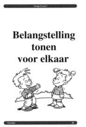
Een voorbeeld van een SOEMO kaart

Er zijn door de ontwikkelgroep vier hoofdthema's vastgesteld: Samen in de klas, school en maatschappij, Communicatie en Gevoelens. Elk hoofdthema zal 2 maanden worden behandeld in de hele school. Dit thema zal door het gebouw middels posters e.d. zichtbaar zijn. Leerkrachten zoeken uit de hoofdthema's elke 2 weken een nieuwe kaart die de klas op dat moment aanspreekt. Hierdoor kunnen we met de kaarten goed aansluiten bij de beleving van de kinderen. Een aantal kaarten komen in ieder geval elk jaar aan bod, bijvoorbeeld pesten. Wij hopen op deze manier middels een plezierige en zeer werkbare methode de sociaal emotionele ontwikkeling van kinderen gericht te stimuleren.